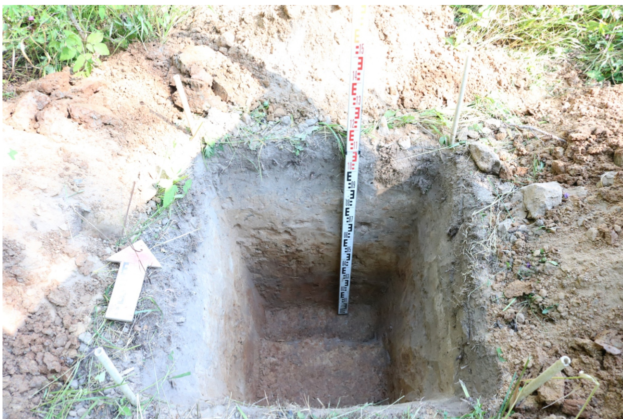
Рис. 27. Археологическое обследование участка по объекту: «Уличные газопроводы дер. Подборье Юхновского района Калужской области». 2023 г. Шурф 2. Материк (контрольный прокоп). Вид с Ю.