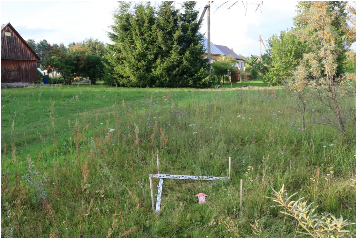
Рис. 20. Археологическое обследование участка по объекту: «Уличные газопроводы дер. Подборье Юхновского района Калужской области». 2023 г. Шурф 1. Общий вид с Ю до начала работ.