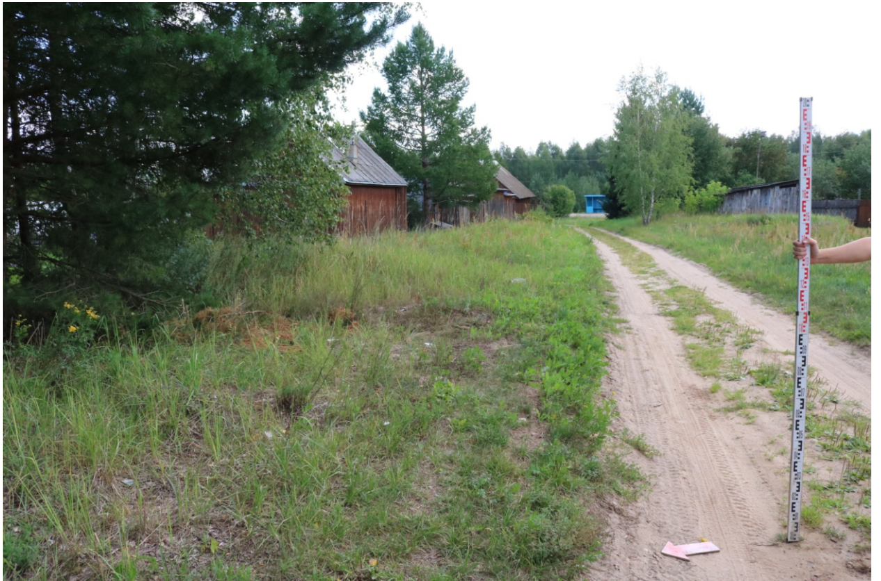
Рис. 16. Археологическое обследование участка по объекту: «Уличные газопроводы дер. Подборье Юхновского района Калужской области». 2023 г. Точка фотофиксации 5. Вид с СЗ.