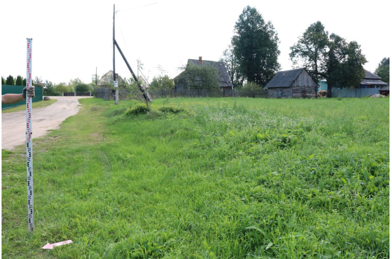
Рис. 11. Археологическое обследование участка по объекту: «Уличные газопроводы дер. Подборье Юхновского района Калужской области». 2023 г. Точка фотофиксации 2. Вид с СЗ.