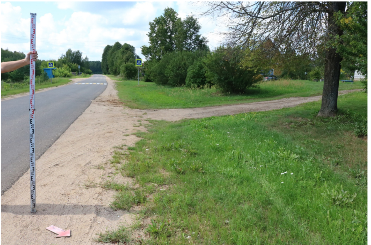
Рис. 15. Археологическое обследование участка по объекту: «Уличные газопроводы дер. Подборье Юхновского района Калужской области». 2023 г. Точка фотофиксации 4. Вид с СВ.