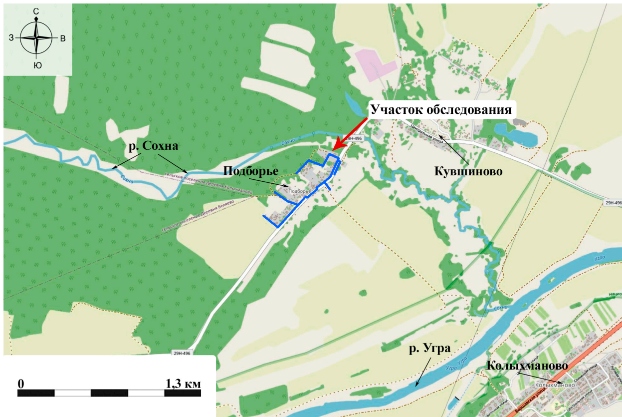
Рис. 3. Археологическое обследование участка по объекту: «Уличные газопроводы дер. Подборье Юхновского района Калужской области». 2023 г. Ситуационный план участка обследования.