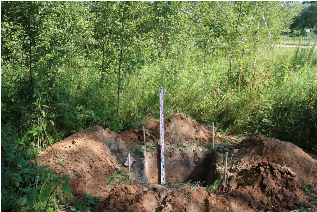
Рис. 26. Археологическое обследование участка по объекту: «Уличные газопроводы дер. Подборье Юхновского района Калужской области». 2023 г. Шурф 2. Общий вид с Ю после завершения работ.