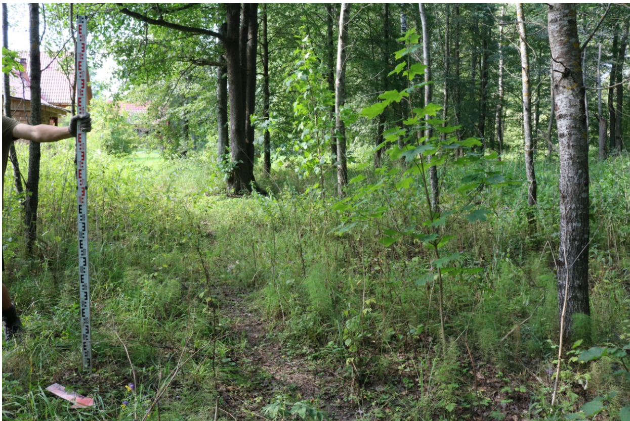
Рис. 8. Археологическое обследование участка по объекту: «Уличные газопроводы дер. Подборье Юхновского района Калужской области». 2023 г. Точка фотофиксации 1. Вид с СВ.