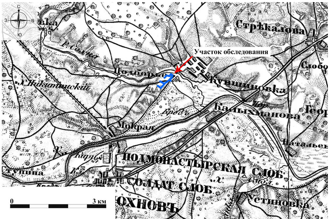
Рис. 5. Археологическое обследование участка по объекту: «Уличные газопроводы дер. Подборье Юхновского района Калужской области». 2023 г. Военно-топографическая карта Калужской области 1868 г. с указанием участка обследования.