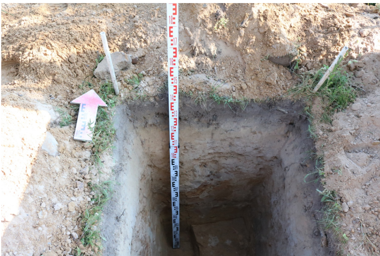
Рис. 23. Археологическое обследование участка по объекту: «Уличные газопроводы дер. Подборье Юхновского района Калужской области». 2023 г. Шурф 1. Северный борт. Вид с Ю.