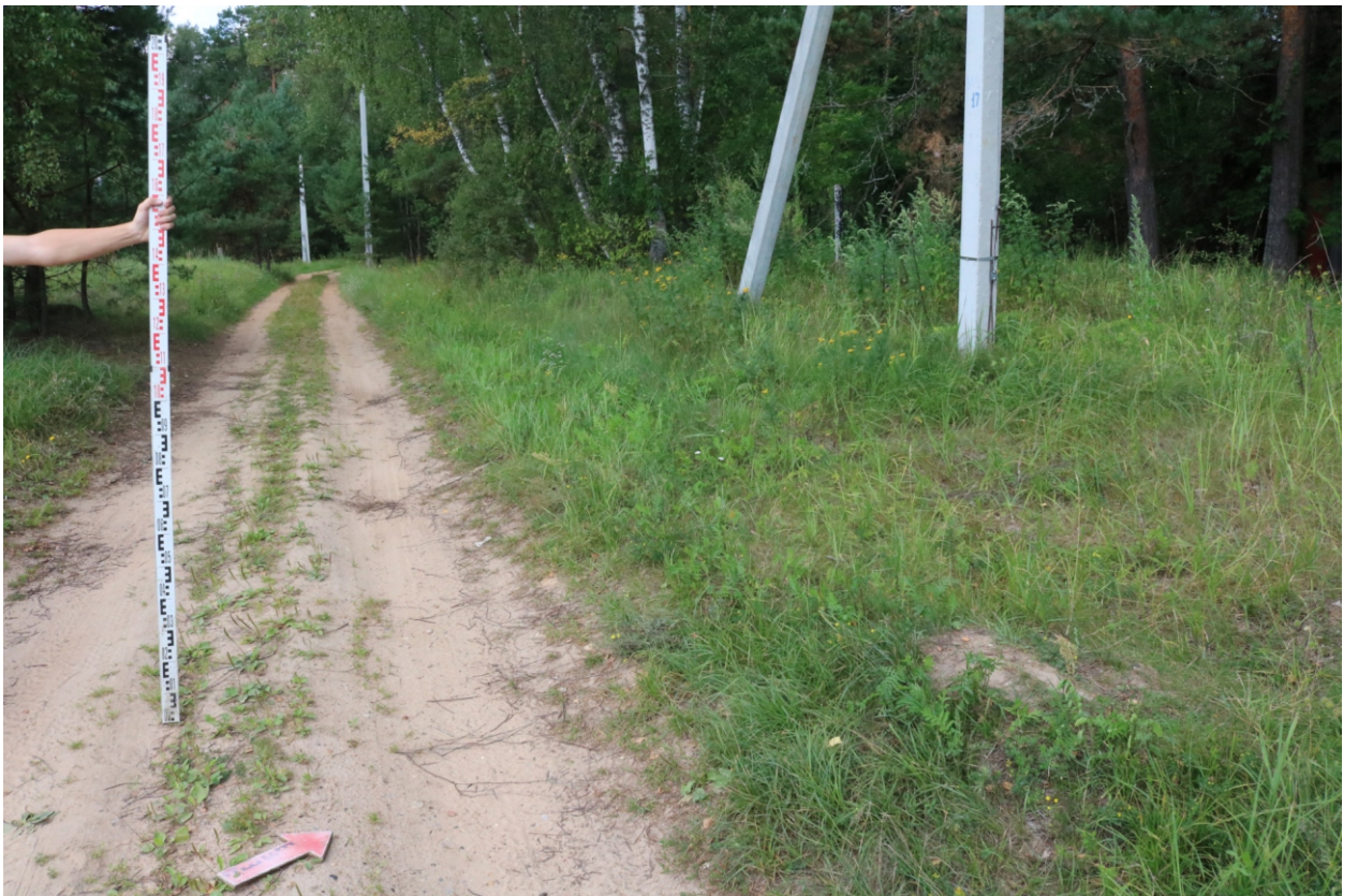
Рис. 17. Археологическое обследование участка по объекту: «Уличные газопроводы дер. Подборье Юхновского района Калужской области». 2023 г. Точка фотофиксации 5. Вид с ЮВ.