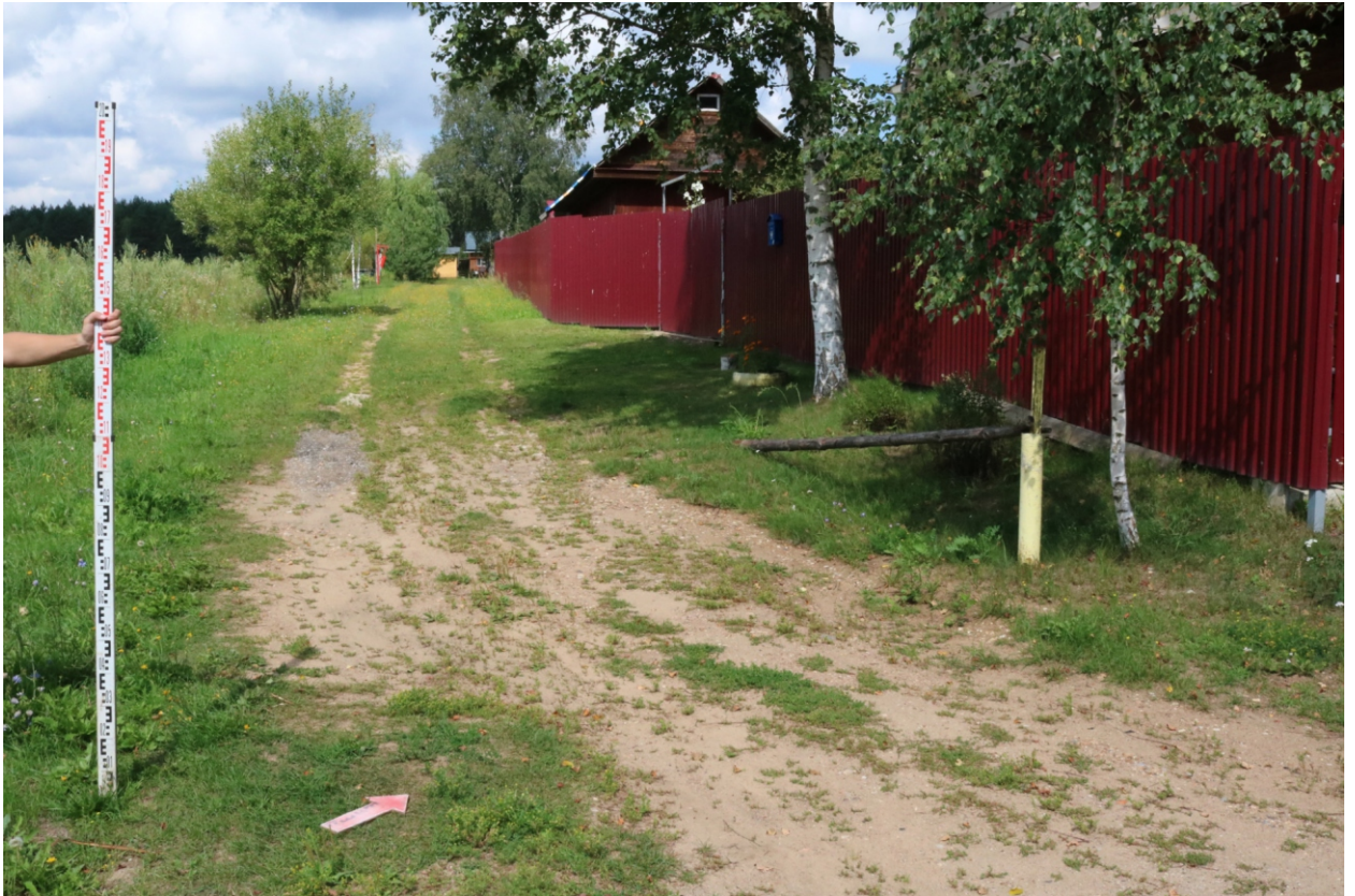
Рис. 18. Археологическое обследование участка по объекту: «Уличные газопроводы дер. Подборье Юхновского района Калужской области». 2023 г. Точка фотофиксации 6. Вид с ЮВ.