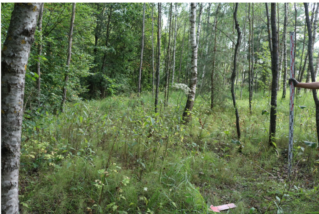
Рис. 9. Археологическое обследование участка по объекту: «Уличные газопроводы дер. Подборье Юхновского района Калужской области». 2023 г. Точка фотофиксации 1. Вид с СЗ.