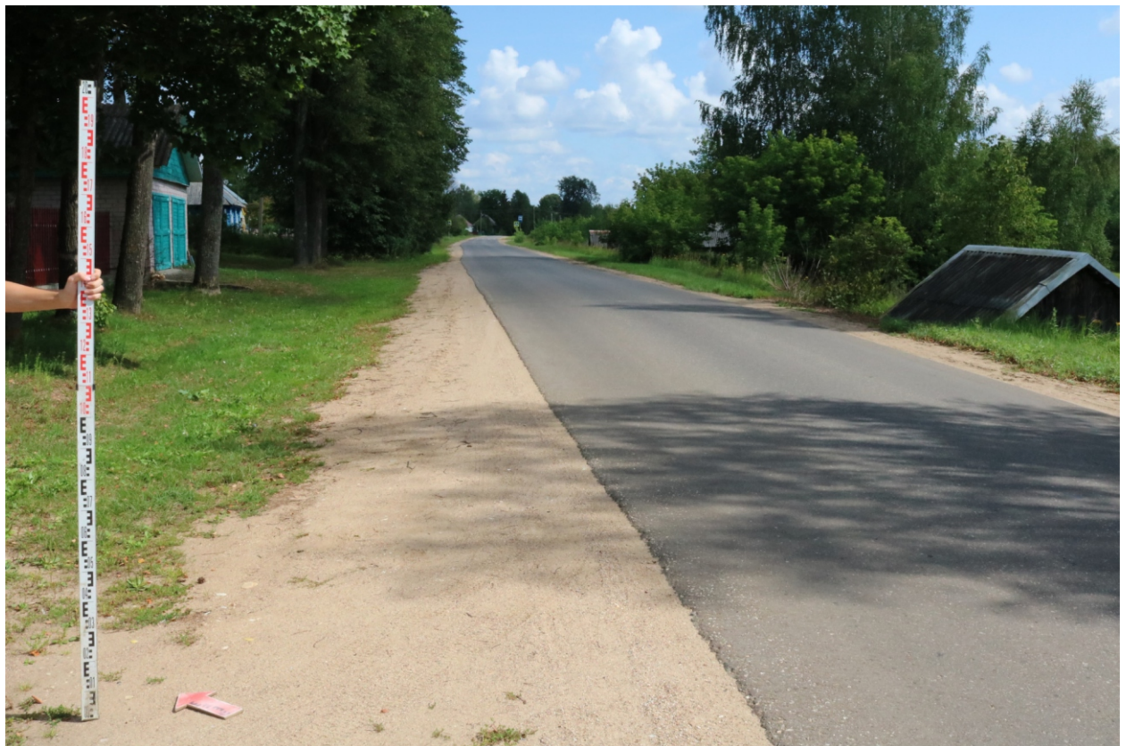
Рис. 19. Археологическое обследование участка по объекту: «Уличные газопроводы дер. Подборье Юхновского района Калужской области». 2023 г. Точка фотофиксации 6. Вид с ЮЗ.