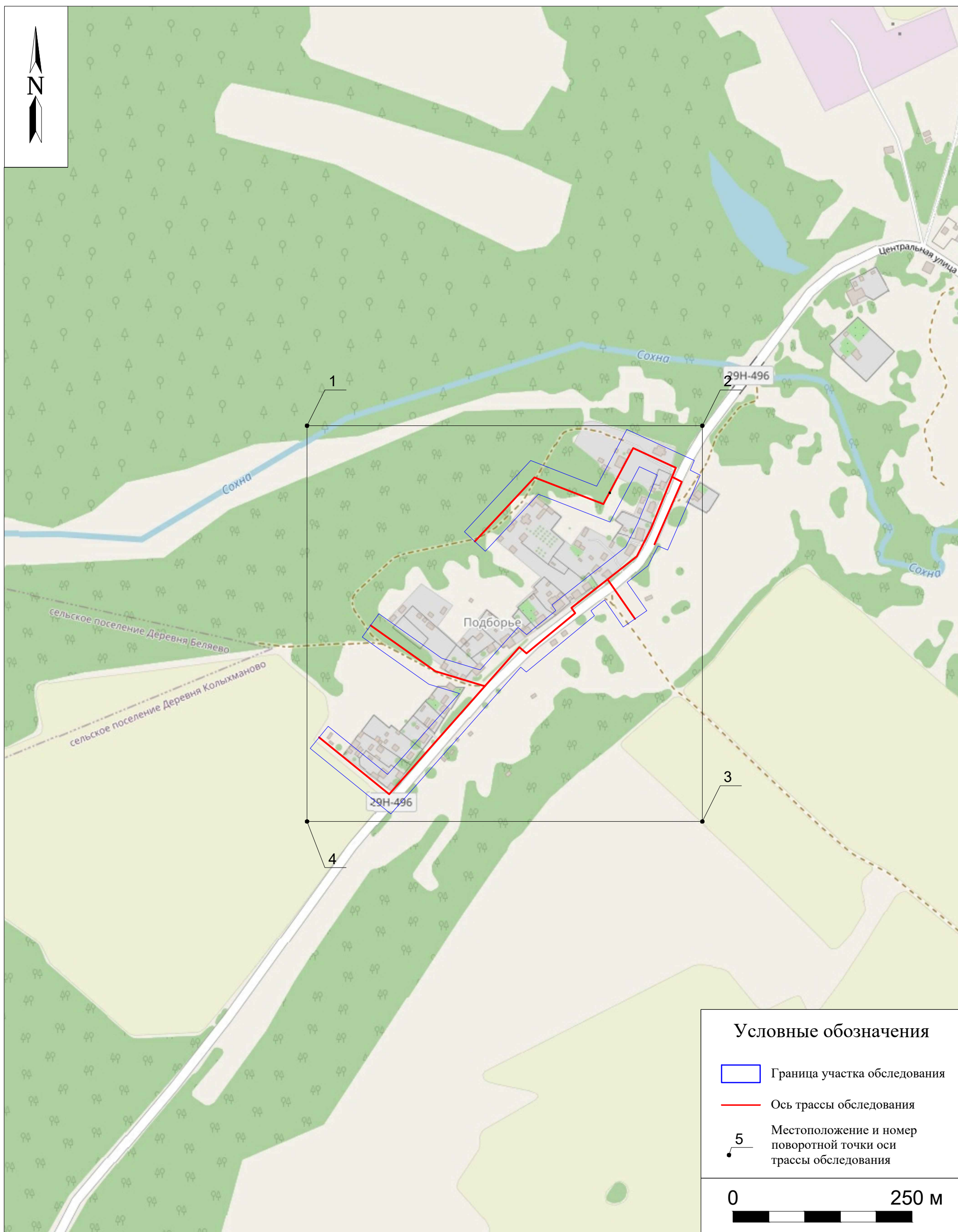
Рис. 6. Археологическое обследование участка по объекту: «Уличные газопроводы дер. Подборье Юхновского района Калужской области». 2023 г. Ситуационный план местности с указанием границ участка обследования и местоположением поворотных точек.