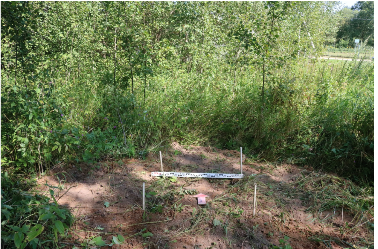
Рис. 29. Археологическое обследование участка по объекту: «Уличные газопроводы дер. Подборье Юхновского района Калужской области». 2023 г. Шурф 2. Рекультивация. Вид с Ю.