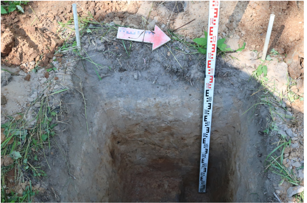
Рис. 28. Археологическое обследование участка по объекту: «Уличные газопроводы дер. Подборье Юхновского района Калужской области». 2023 г. Шурф 2. Западный борт. Вид с В.