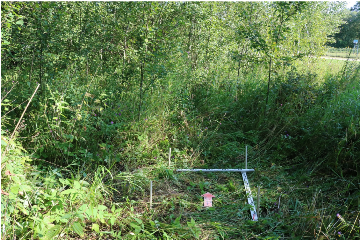
Рис. 25. Археологическое обследование участка по объекту: «Уличные газопроводы дер. Подборье Юхновского района Калужской области». 2023 г. Шурф 2. Общий вид с Ю до начала работ.