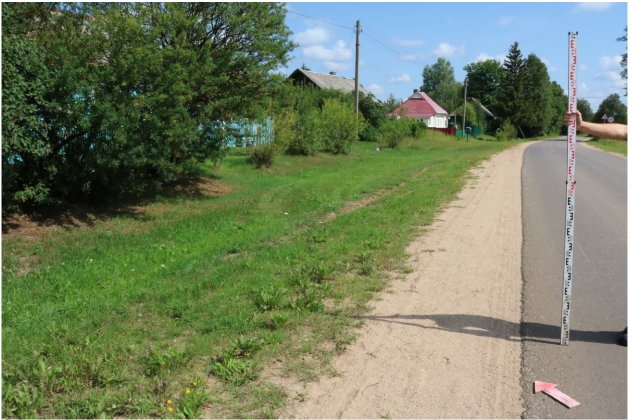
Рис. 14. Археологическое обследование участка по объекту: «Уличные газопроводы дер. Подборье Юхновского района Калужской области». 2023 г. Точка фотофиксации 4. Вид с ЮЗ.