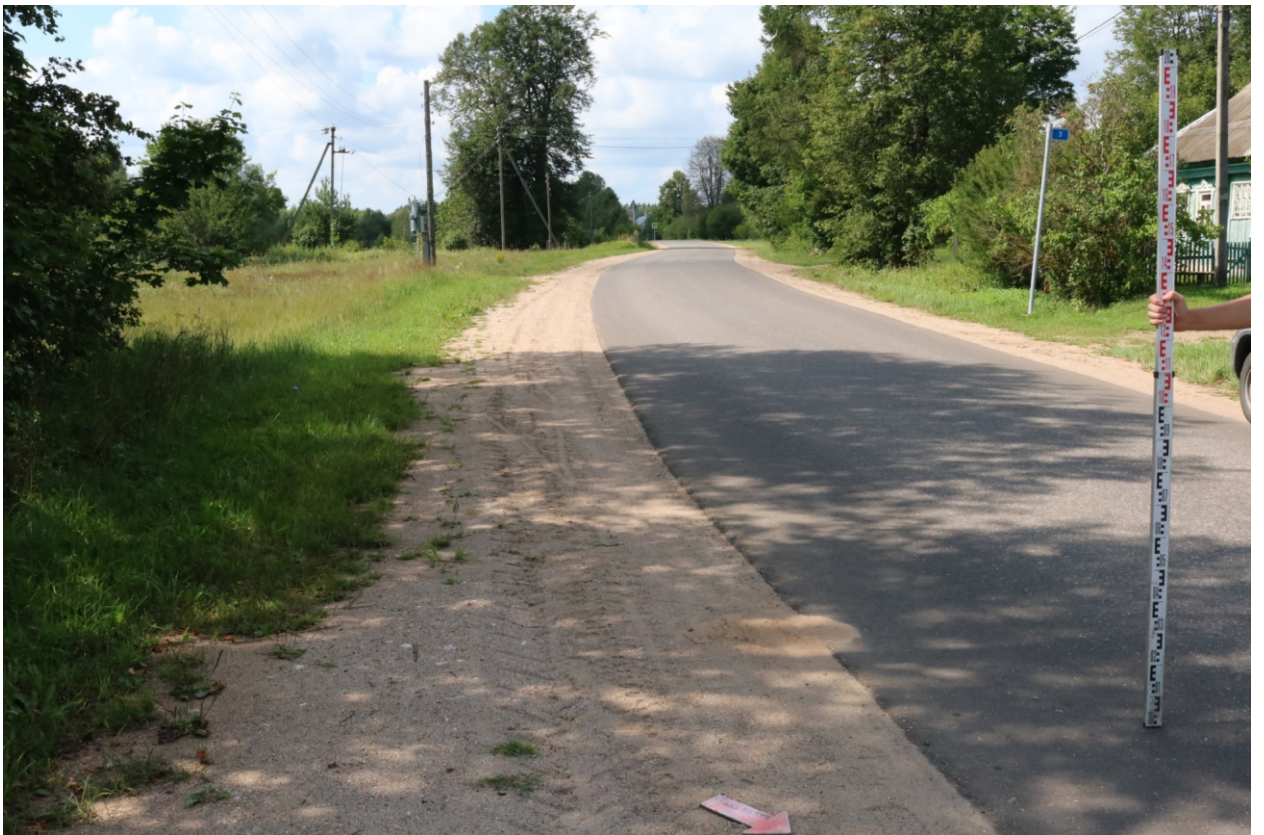
Рис. 13. Археологическое обследование участка по объекту: «Уличные газопроводы дер. Подборье Юхновского района Калужской области». 2023 г. Точка фотофиксации 3. Вид с СВ.