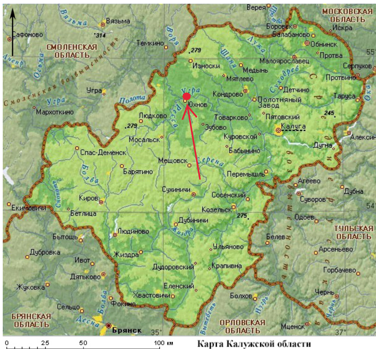
Рис. 2. Археологическое обследование участка по объекту: «Уличные газопроводы дер. Подборье Юхновского района Калужской области». 2023 г. Карта Калужской области с указанием местоположения участка обследования.