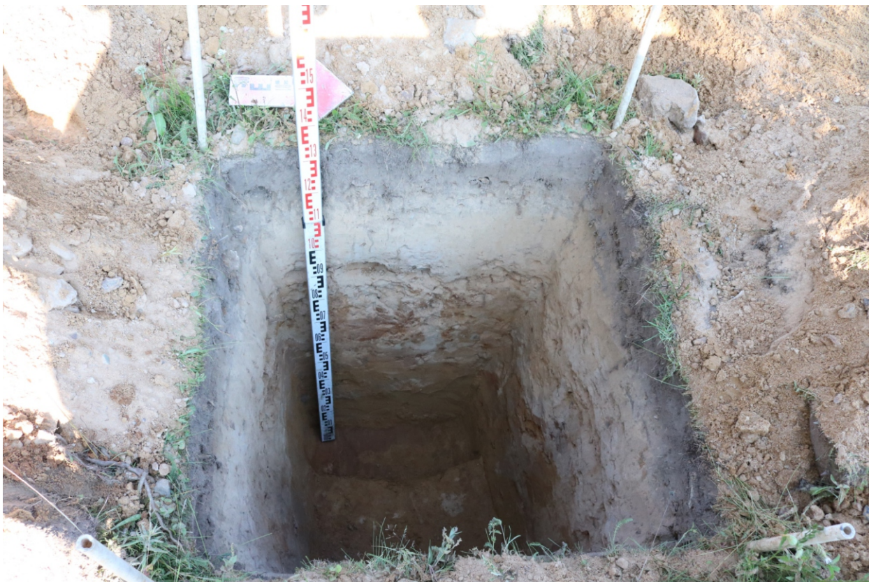
Рис. 22. Археологическое обследование участка по объекту: «Уличные газопроводы дер. Подборье Юхновского района Калужской области». 2023 г. Шурф 1. Материк (контрольный прокоп). Вид с В.