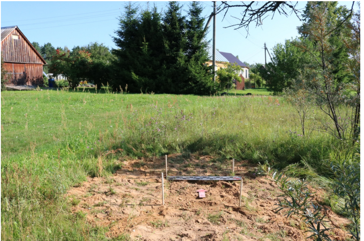
Рис. 24. Археологическое обследование участка по объекту: «Уличные газопроводы дер. Подборье Юхновского района Калужской области». 2023 г. Шурф 1. Рекультивация. Вид с Ю.