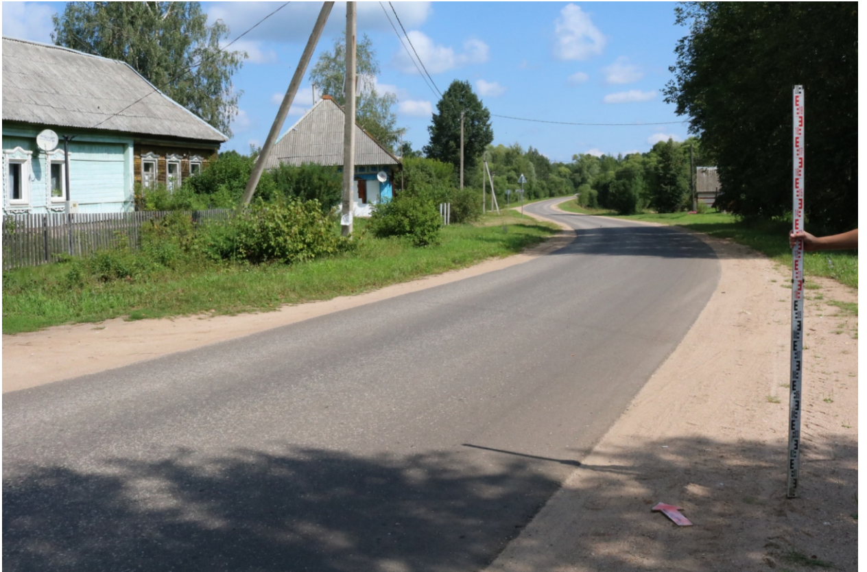
Рис. 12. Археологическое обследование участка по объекту: «Уличные газопроводы дер. Подборье Юхновского района Калужской области». 2023 г. Точка фотофиксации 3. Вид с ЮЗ.