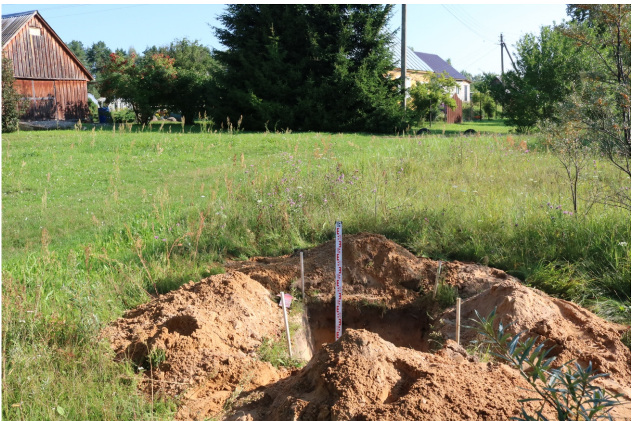
Рис. 21. Археологическое обследование участка по объекту: «Уличные газопроводы дер. Подборье Юхновского района Калужской области». 2023 г. Шурф 1. Общий вид с Ю после завершения работ.