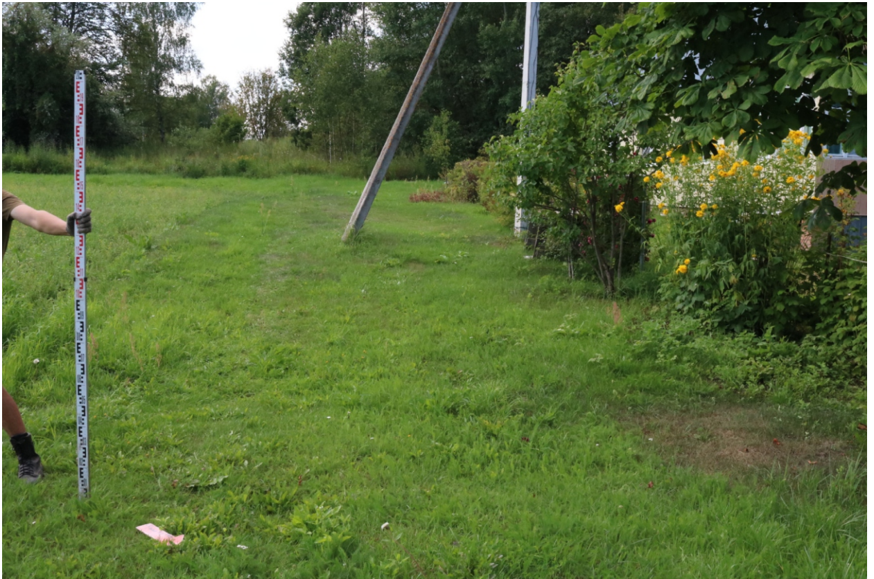
Рис. 10. Археологическое обследование участка по объекту: «Уличные газопроводы дер. Подборье Юхновского района Калужской области». 2023 г. Точка фотофиксации 2. Вид с СВ.